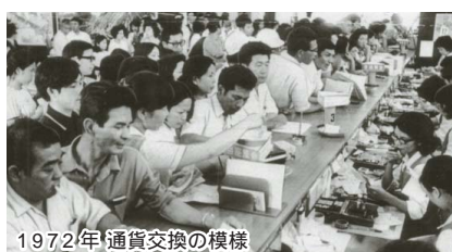
1972年 通貨交換の様相

平成14年6月には、経営環境の変化に即応し、競争力の強化ならびに効率的な経営の実現を目指して、執行役員制度を導入しました。