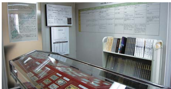
「りゅうぎん金融資料館」館内

琉球銀行ならびにりゅうぎん総合研究所では、平成23年4月、那覇市壺川のりゅうぎん総合研究所内に「りゅうぎん金融資料館」を開設しました。