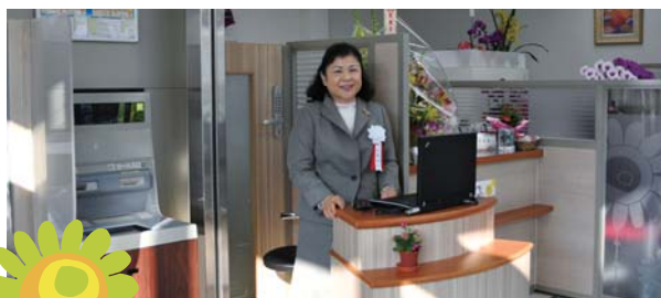
店内の総合受付窓口

琉球銀行では、平成23年2月、個人のお客さまの資産運用ニーズにお応えする個人特化型ミニ店舗の1号店として、「りゅうぎんハロープラザ石田店」(正式名称:寄宮支店 石田出張所)を那覇市繁多川に開設しました。