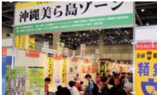
りゅうぎんビジネスクラブ会員企業のブース

りゅうぎんビジネスクラブの会員企業のブースは、沖縄素材への関心の高さを背景に、終日、大勢の来場者でにぎわいました。二日間の商談成立件数は四十八件となり、販路拡大に大きな成果があげられました。