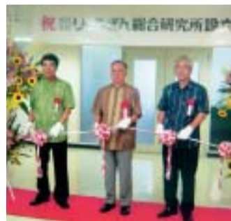
りゅうぎん総合研究所オープンセレモニー

本ケースは、「おきなわ中小企業再生ファンド」活用のお県内第一号案件となりました。今後、同ファンドにおいて、過大債務の整理ならびに収益力強化支援を図り、三年以内の債務過多解消を目指しています。