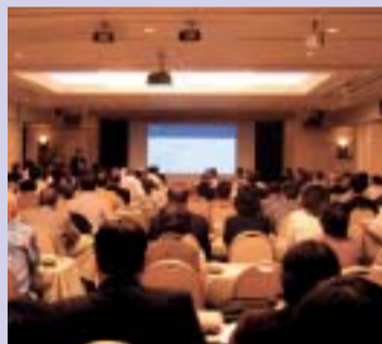
事業承継セミナー

題してセミナーを開催しました。セミナーではファミリー企業のオーナーにとって知っておくべき重要ポイントが的確に解説され、参加したファミリー企業のオーナーや経営者に好評でした。