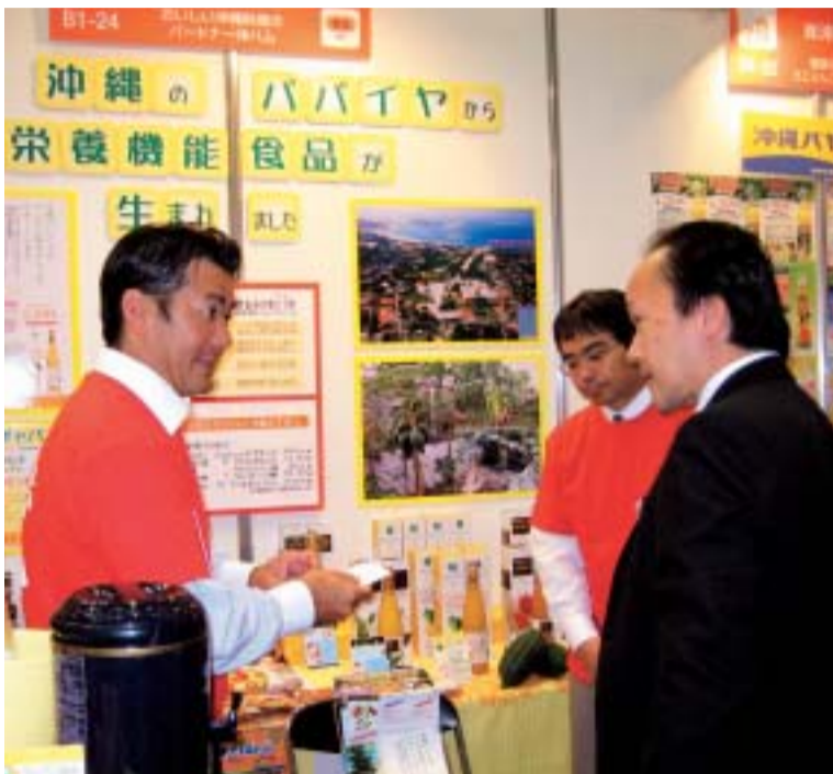
熱心に説明するビジネスクラブ会員企業スタッフ

将来的には、情報分析機能を生かした経営コンサル業務への展開や、基地跡地など地域開発事業の調査にも積極的に関わっていくことを目指しています。