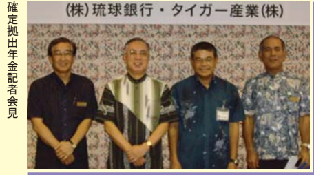
確定拠出年金記者会見