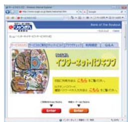
インターネットバンキングの体験コーナー

琉球銀行のホームページではインターネットバンキングの体験コーナーを設置していますので、是非お気軽にお試しください。