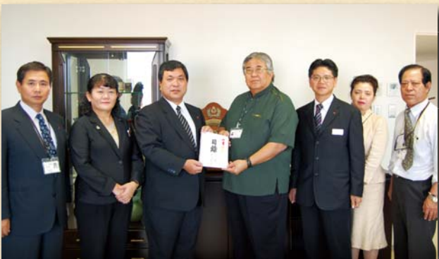
日本赤十字社沖縄県支部へ義援金を贈呈

りゅうぎんユイマール助成会および琉球銀行は、2010年10月に発生し多大な被害を受けた奄美豪雨被災者を支援するため、日本赤十字社沖縄県支部を通じて義援金を贈呈しました。琉球銀行は、1948年の設立以降、1953年まで奄美地域に最大5カ店の支店を有していた歴史を持ち、奄美地域にゆかりがあります。贈呈式には、両親が奄美出身であるなど奄美と関係のある当行員も同席しました。