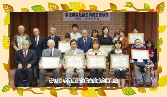
第16回 宇流麻福祉基金助成金授与式