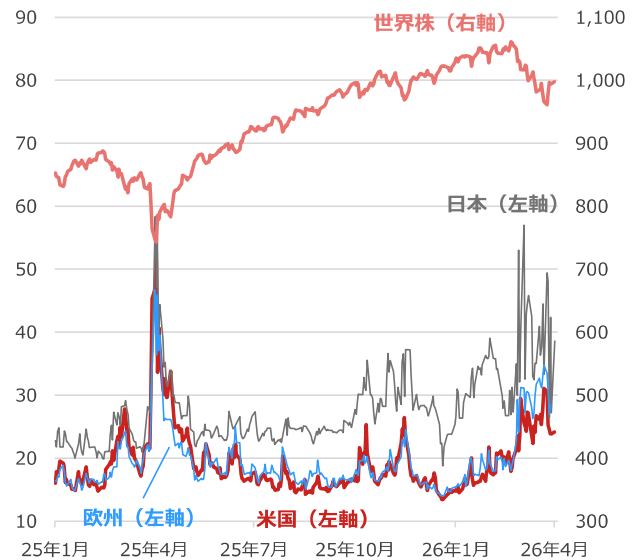
日米欧のボラティリティ・インデックスと世界株

期間：(欧VSTOXX) 2025年1月6日～2026年4月2日、日次 (その他) 2025年1月6日～2026年4月6日、日次 ・世界株はMSCI All Country World Index (米ドルベース) ・ボラティリティ・インデックスは一般的に同指数の数値が高いほど、投資家の先行き不透明感が強いとされる (別名：恐怖指数)。日本は日経平均VI、米国はVIX、欧州はVSTOXX。